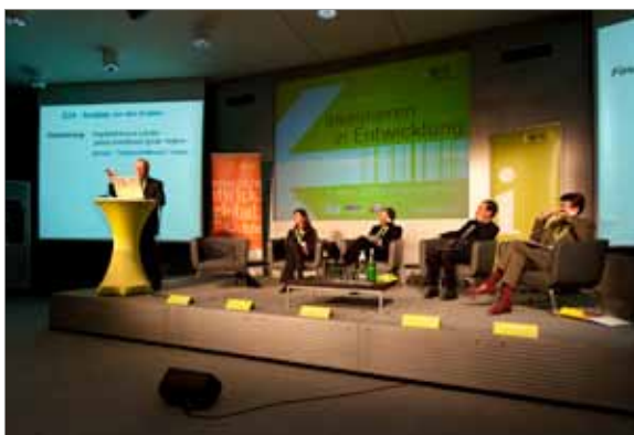
Fachtagung „Investieren in Entwicklung“ – Plenum

Ein Publikum von über hundert Teilnehmern – Vertreter der Wirtschaft, der Entwicklungszusammenarbeit, der öffentlichen Verwaltung und der Wissenschaft – zeigt die Relevanz des Themas.