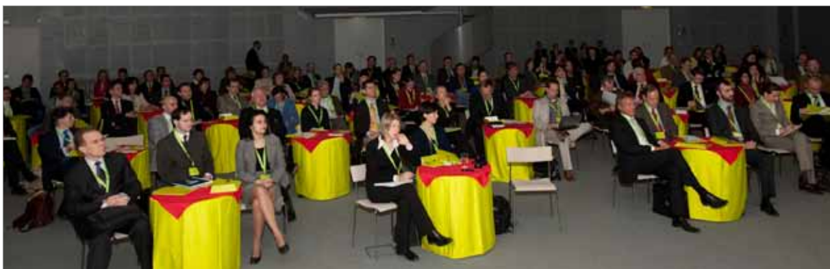
Fachtagung „Investieren in Entwicklung“ – Auditorium

sicherlich auch in Zukunft auf diese Länder konzentrieren werde. Dabei bleibe es wichtig, den Unternehmen jedwede Art von Unterstützung zu bieten. „Die Frage ist, ob wir es schaffen, die Dynamik auch in Zukunft fortzusetzen“, gibt sich de Colle vorsichtig. Allerdings vermerkt er anerkennend, dass in der Vergangenheit Dinge geschehen seien, die man nicht für möglich gehalten hätte. Damit bezieht er sich vor allem auf die so genannten Wirtschaftspartnerschaften, die die ADA Unternehmen bei einem Schritt in Entwicklungsländer anbietet. Dass dieses Programm von den Unternehmen auch angenommen wird, sei ein guter Beweis, dass Wirtschaft und Entwicklung miteinander kooperieren können. Mit Bezug auf seinen Vorredner stellt de Colle fest, dass es gut klinge, die Krise antizyklisch zu nutzen. Es sei allerdings ein Ressourcenproblem, und zwar finanziell und personell. De Colle hofft dennoch, dass die Kooperation mit der EZA weitergehe: Es sei ein Pflänzchen, das man weitergießen müsse, um es am Leben zu erhalten. „Es ist ein junger Trend und war nicht immer so“, so de Colle. Wichtig sei ihm, Wirtschaft und Entwicklung in der öffentlichen Wahrnehmung positiv zu verankern. Es gehe darum, positive Beispiele darzustellen nach dem Motto: „Tue Gutes und rede davon.“